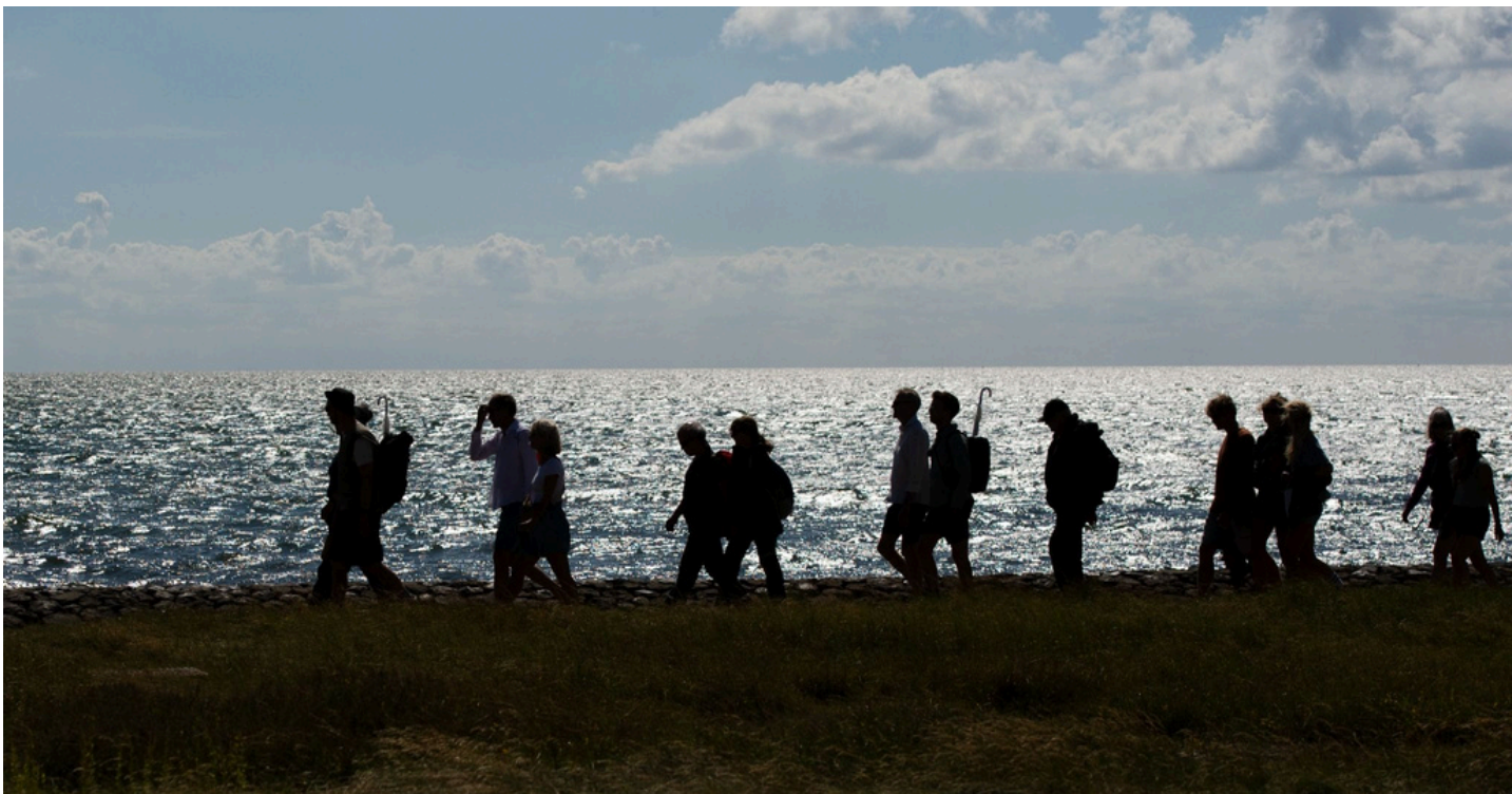
Participatieve wandeling van Sijas de Groot en Sjoerd Willem Bosch, korte residentie